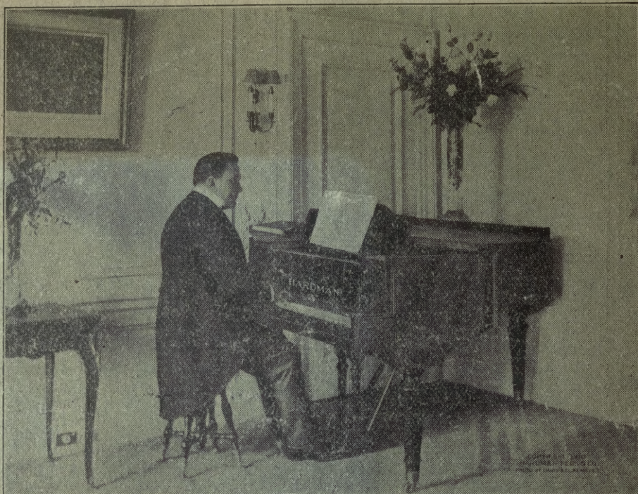
Mr. Caruso at the HARDMAN Piano

“With best wishes for the success of my favorite instrument, the Hardman.”